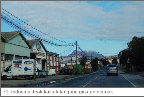
71. Industrialdeak kalitateko gune gisa antolatua