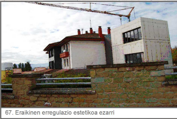
67. Eraikinen erregulazio estetiko ezarri

49. Berriki egindako garapenak herrigunearekin lotu