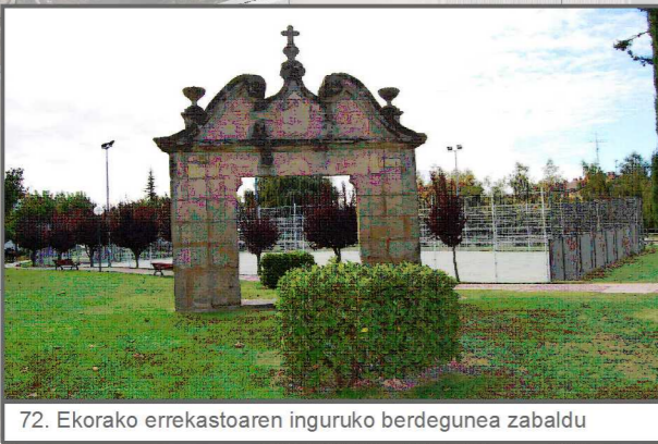
72. Ekorako erreka inguruko berdegunea zabaldu