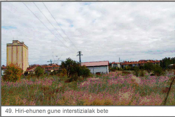
49. Hiri-ehunen gune interstizialak bete