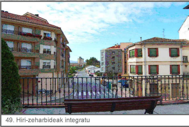
49. Hiri-zeharbideak integratu