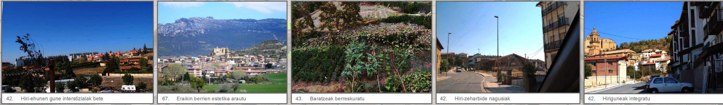
42. Hiri-ehunen gune interstizialak bete 67. Eraikin berrien estetika arautu 43. Baratzeak berreskuratu 42. Hiri-zeharbide nagusiak 42. Hiriguneak integratu