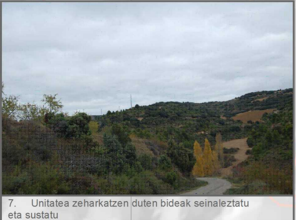
7. Unitatea zeharkatzen duten bideak seinaleztatu eta sustatu