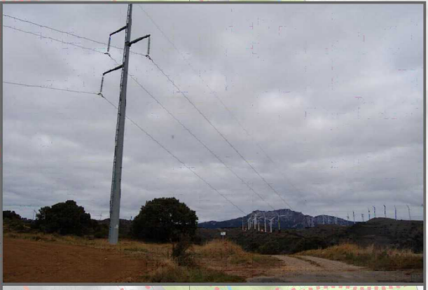
10. Ahal den neurrian, goi-tentsioko lineen inpaktua saihestu