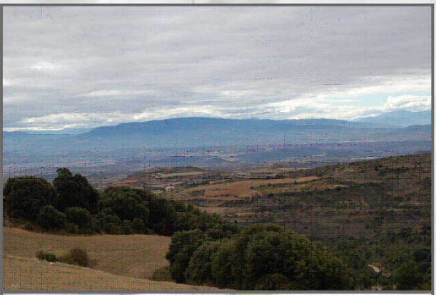
7. Ikuspegi-aukera handia duten lekuak seinaleztatu, eta ikus datekeen horri buruzko informazio-orrria gehitu