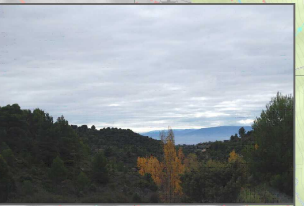
31. Unitatearen izaera naturalari eutsi, mendia garbi eta zainduta gordez