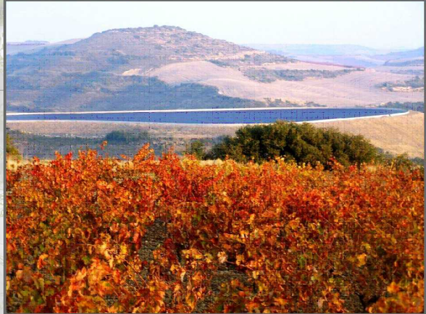
9. Ureztatze-urak behar bezala integratzen direla bermatu, ezpondetako zuhaitzi-proiektuen bidez, besteak beste.