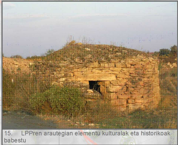
15. LPPren arautegian elementu kulturalak eta historikoak babestu