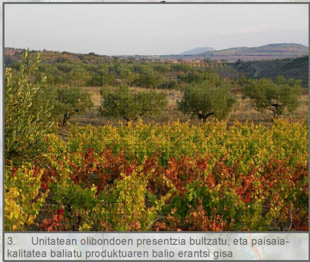
3. Unitatean olibondoaren presentzia bultzatu, eta paisaia-kalitatea baliatu produktuaren balio erantsi gisa