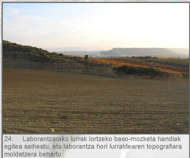
24. Laborantzarako lurak lortzeko baso-mozketa handiak egitea saihestu, eta laborantza hori lurraldearen topografiara moldatzera behartu