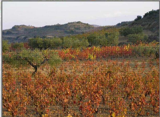
24. Laboreen mosaikoa zaintzea sustatu, eta malda handieneko eremuetan matrice naturala babestu