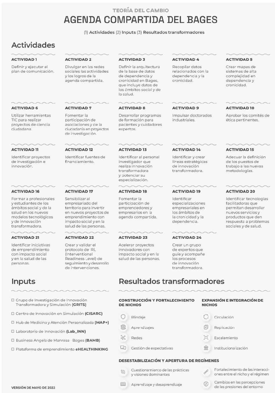
Figura nº 3. ACTIVIDADES DE LA TEORÍA DE CAMBIO DE LA AC DEL BAGES