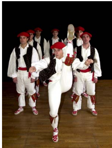
Bizkaiko dantzari dantza

Gure dantzek funtsean gure mugen barruan iraun badute ere, dantzari on izatearen famaren eta gure pausoen kalitatearen berri izan dute dantzako maisu handiek. Gainera, “comedies-ballets” izenekoetan (Moliereren eta Lulliren arteko elkarlanaren emaitza), birtuosismo maximoko koreografia zuten zatietan, dantzari euskaldunen presentzia egiazta daiteke.