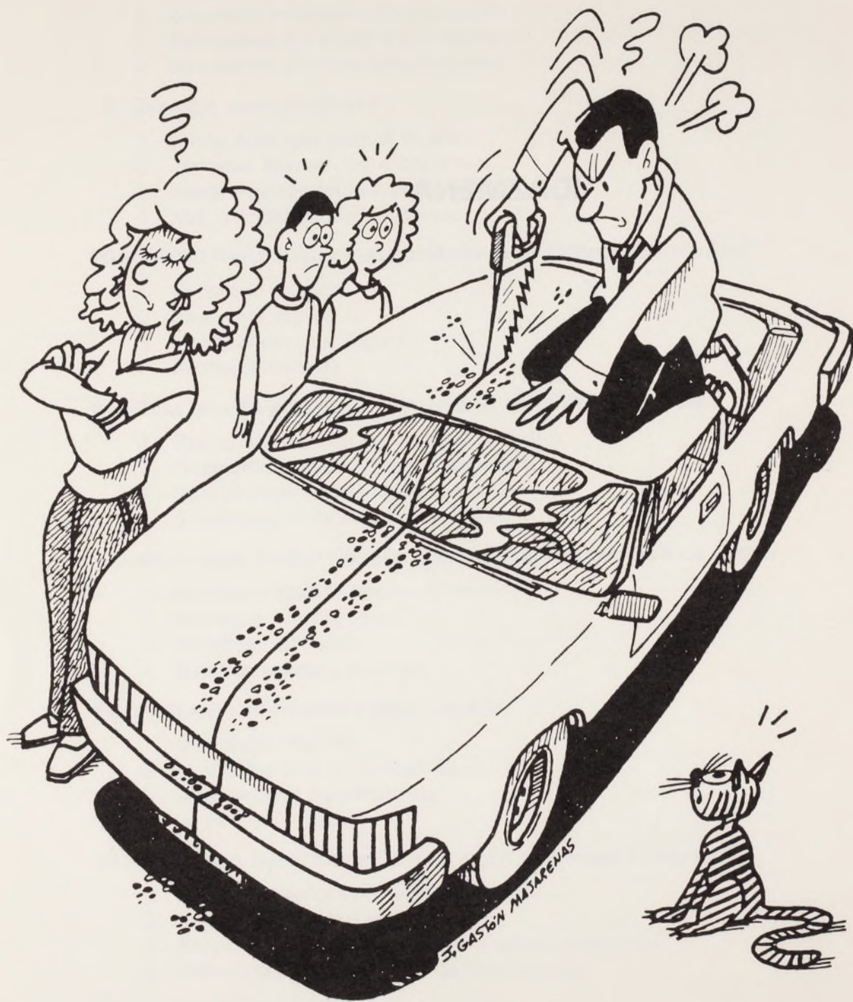
(In HABE, Mintzamina lantzen , Donostia 1986)