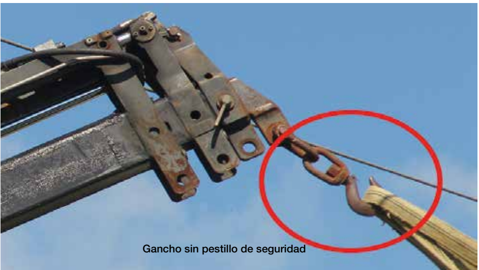
Gancho sin pestillo de seguridad