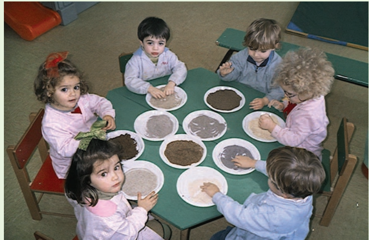
Umeak ikertzeko baliabide ezberdinak erabiltzen dituzte. Harearen ehundura anitzen berri izateko eskuak erabiltzen dituzte.