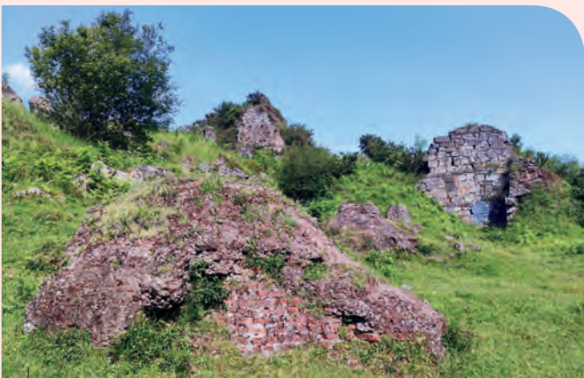
Hornos de calcinación de Parkotxa

Burdina mineralaren ustiapena amaitu zenean, azpiegitura gehienak desagiten edo abandonatzen joan ziren eta aire zabaleko erauzketa masiboaren ondorioz sortutako “ilargi-paisaiak” bere berreskuratze natural motela hasi zuen. Gaur egun, zoritxarrez, kontserbatzen diren aztarna gutxi horiek desagertzen edo hondatzen jarraitzen dute; beraz, gero eta premiazkoagoa da horiek babestea eta kultura-ondare horri balioa ematea. Gure ondare historikoa desagertzeak kultur pobretzera eta gure nortasuna galtzera garamatza. Burdinaren meataritzak eta ondorengo eraldaketak gaur egungo Bizkaiaren ezaugarri ekonomiko eta sozialak sendotu zituzten. Gure iragan kolektiboak garen bezalakoa izatera eraman gaitu. Nondik gatozen ahaztuz gero, oso zaila da nora joan nahi dugun jakitea, eta oso erraza da akats berberak errepikatzea. Horregatik, beharrezkoa da ondare historiko eta kultural garrantzitsu hau ez galtzea, gogoan izan behar baita “beren historia ahazten duten herriak errepikatuzera kondenatuta daudela” .