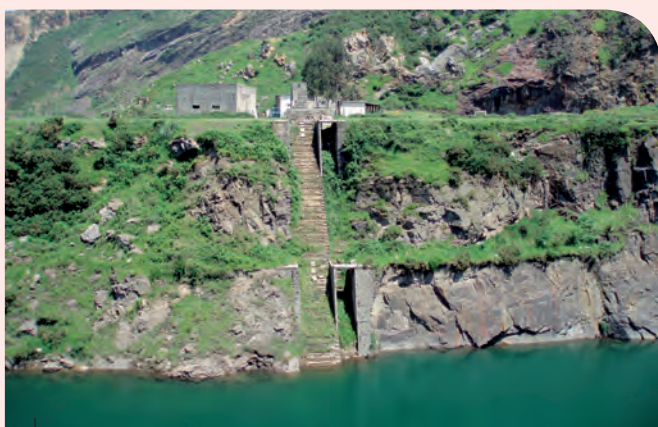
Plano inclinado en el pozo Blondis