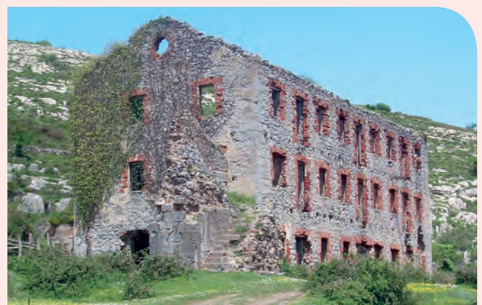
Casa minera en El Saúco