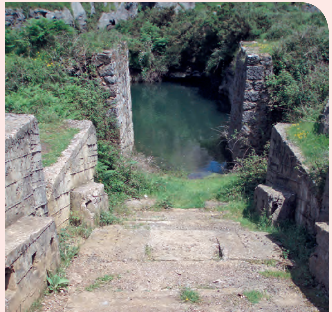
Plano inclinado de Parkotxa

Conferencia General de la UNESCO, Nairobi 1976