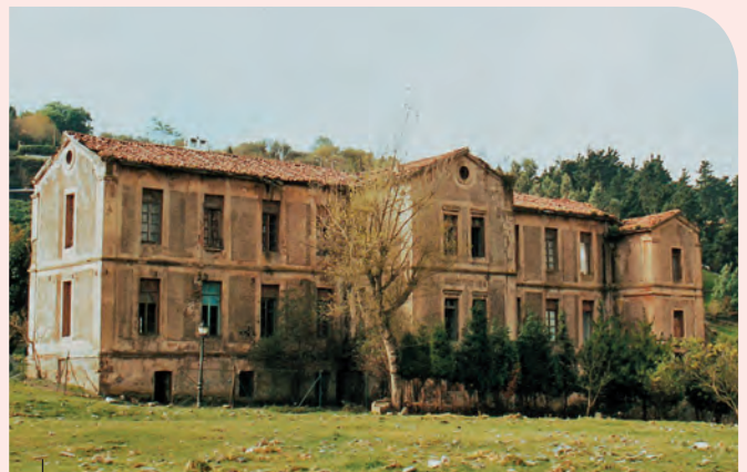
Hospital minero de La Arboleda

Al finalizar la explotación del mineral de hierro, que tuvo su mayor auge a finales del siglo XIX y principios del XX, la mayoría de las infraestructuras se fueron desmantelando o abandonando, los barrios mineros se fueron despoblando, llegando muchos de ellos a desaparecer y el “paisaje lunar”, originado por la extracción masiva a cielo abierto, inició su lenta recuperación natural.