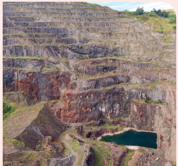
Corta Concha 2ª