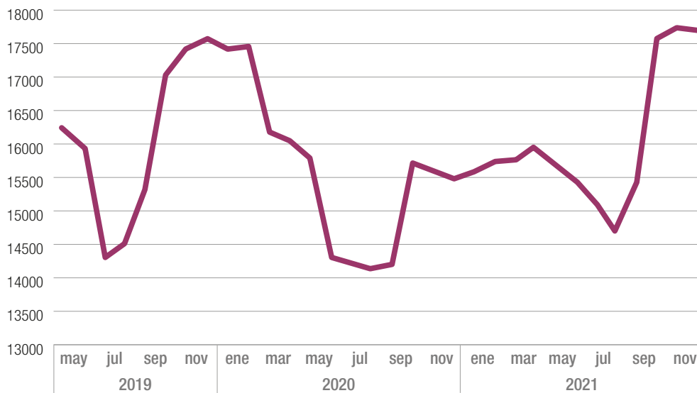
GRÁFICO 11.1 EVOLUCIÓN DE LAS AFILIACIONES A LA SEGURIDAD SOCIAL DE LA RAMA ACTIVIDAD RR ACTIVIDADES RECREATIVAS Y CULTURALES