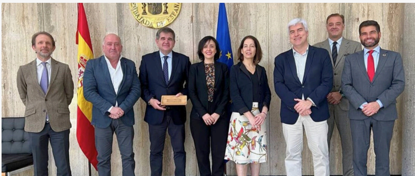
EAEko ordezkariak Espainiaren Enbaxadarekin eta Garapenerako Nazioarteko Lankidetzaren Espainiako Agentziarekin (AECID)