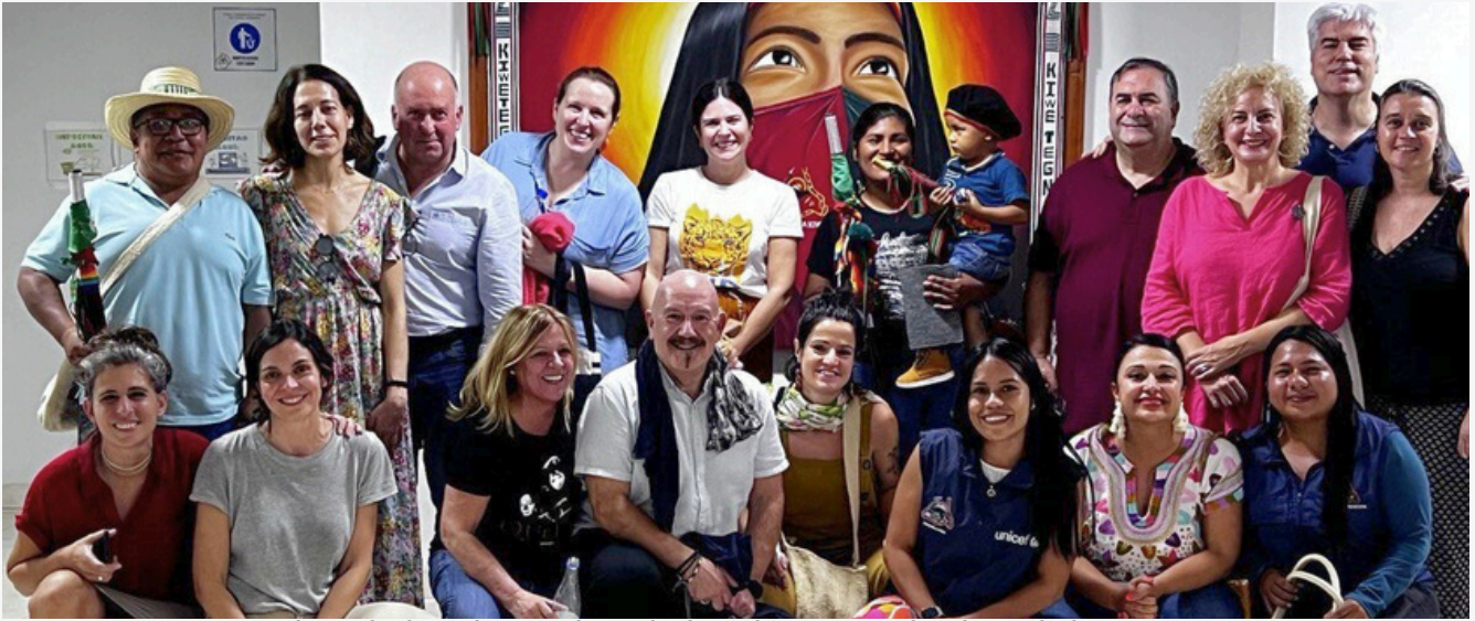
EAEko ordezkariak ACINeko ordezkariekin (Santander de Quilichao, Cauca)