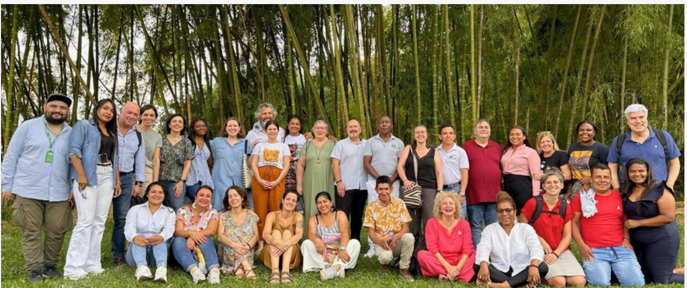
EAEko ordezkariak Caucaoko giza eskubideen aldeko erakundeetako ordezkariekin (Santander de Quilichao)