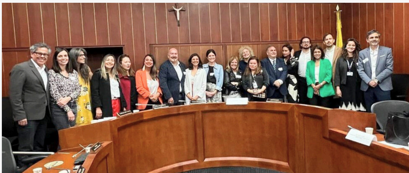
EAEko ordezkariak eta Errepublikako Ordezkarien Ganberako Giza Eskubideen eta Entzutegien Batzordea