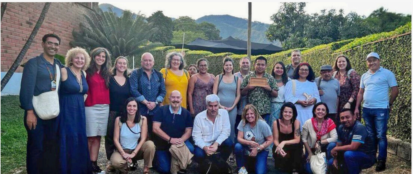
EAEko ordezkariak OIAko ordezkariekin (Medellin, Antiokia)

Antiokiako Elkarte Indigenako (OIA) ordezkariak, EAEko ordezkariekin bilduta, esan dute herri horiek sarraski-arriskuan daudela (fisikoa, kulturala, lurraldekoa eta epistemologikoa).