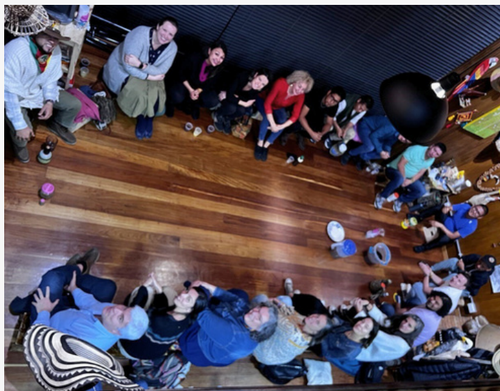
EAEko ordezkariak eta ONICEko ordezkariak (Bogota)