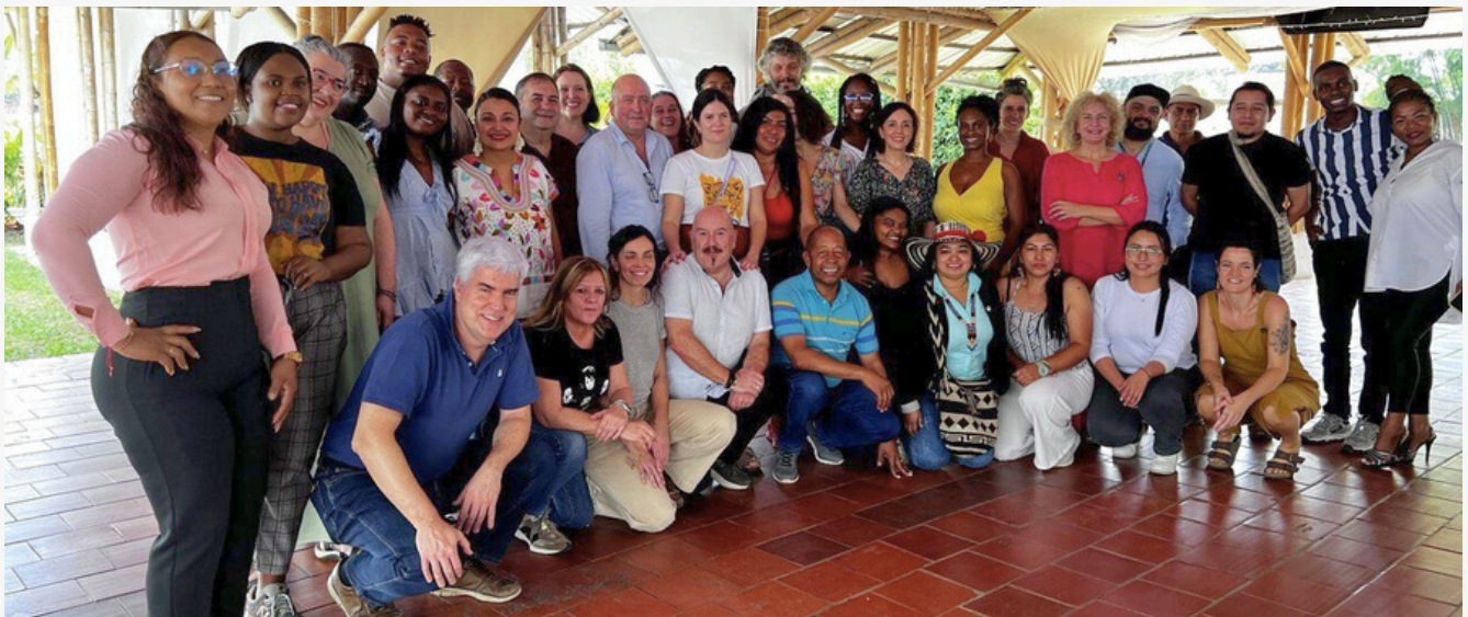
EAEko ordezkariak ACONCko ordezkariekin (Santander de Quilichao, Cauca)

2015–2035 urteetarako Bizi Onaren Plana, Antzinako Etika eta Justizia Auzitegiak eraginkor egiten duen Ipar Caucako herri beltzaren antzinako justizia-sistema eta Guardia Cimarrona ezartzea, eta beste herrialdeetako erakunde eta antolakundeekin elkartasun-sareak sortzea, hala nola EAEko Babes Programa.