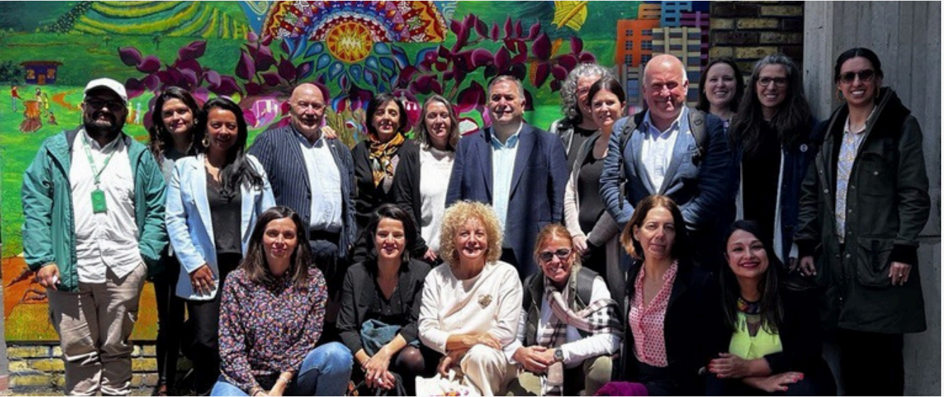
EAEko ordezkariak eta giza eskubideen aldeko erakundeetako ordezkariak (Bogota)

Txosten horrek adierazten dituen dinamiketako batzuk egiaztatu ahal izan zituzten EAEko ordezkariak Kolonbiako lurraldeetara egindako bisitetan, topaketak eta elkarrizketak egin diren erakundeek jakinarazita: