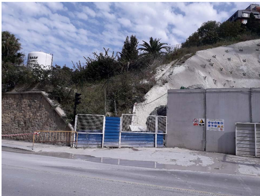
Imagen 2.- Emboquille Rampa 1 en Avenida Zarautz