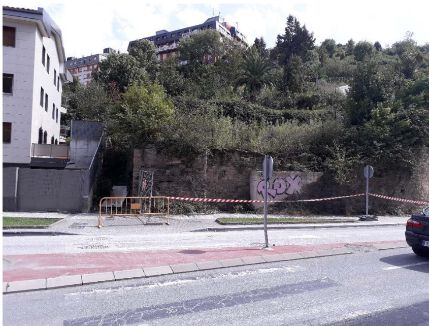
Imagen 7.- Muro existente entre edificación y emboquille