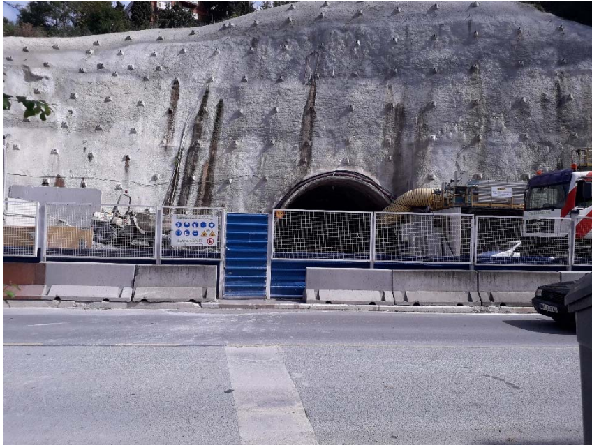
Imagen 1.- Emboquille Rampa 1 en Avenida Zarautz