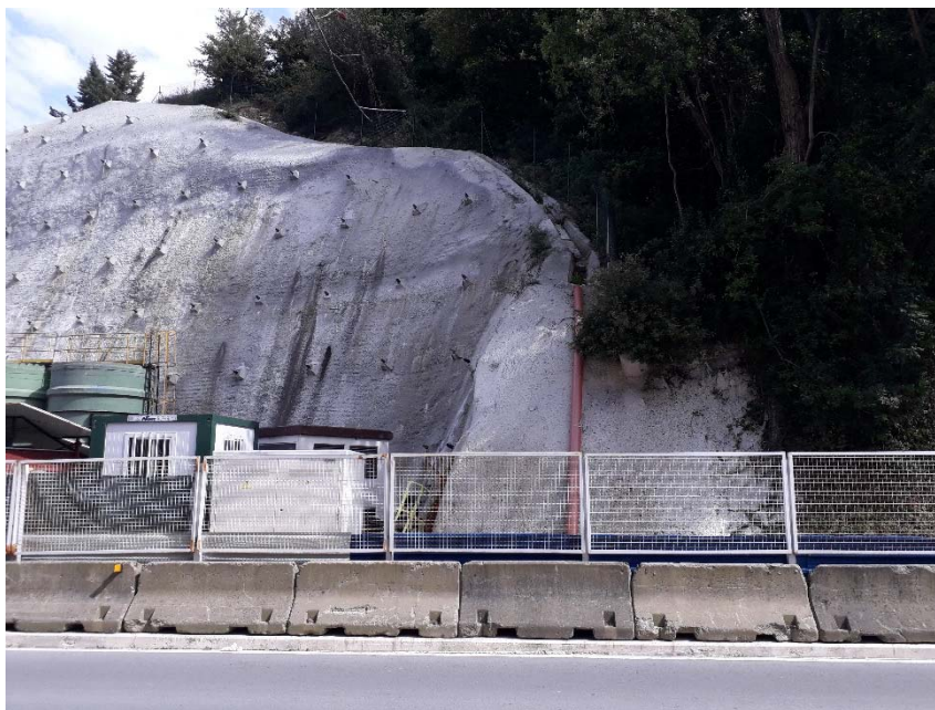
Imagen 3.- CT 13,2 kV para ejecución de la obra civil