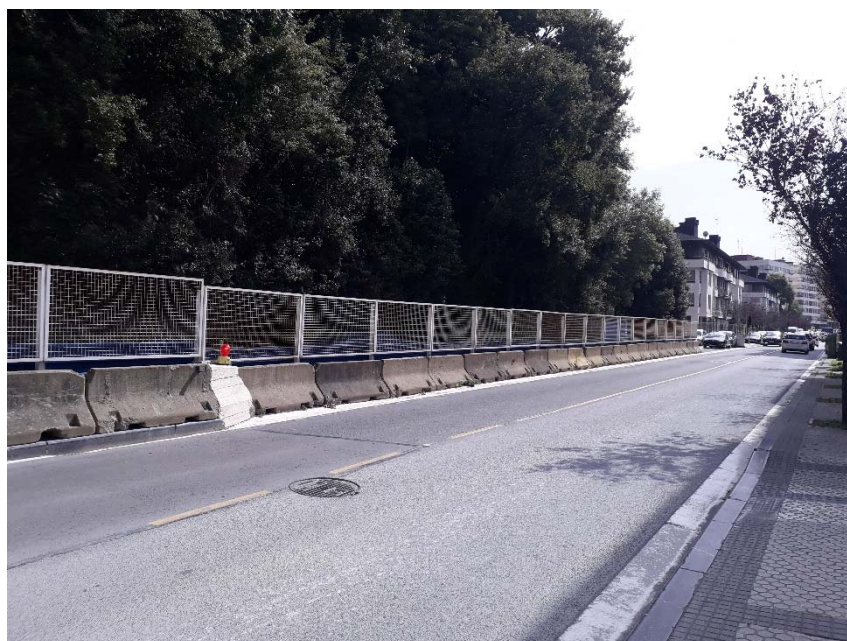
Imagen 5.- Avenida Zarautz, sentido sur