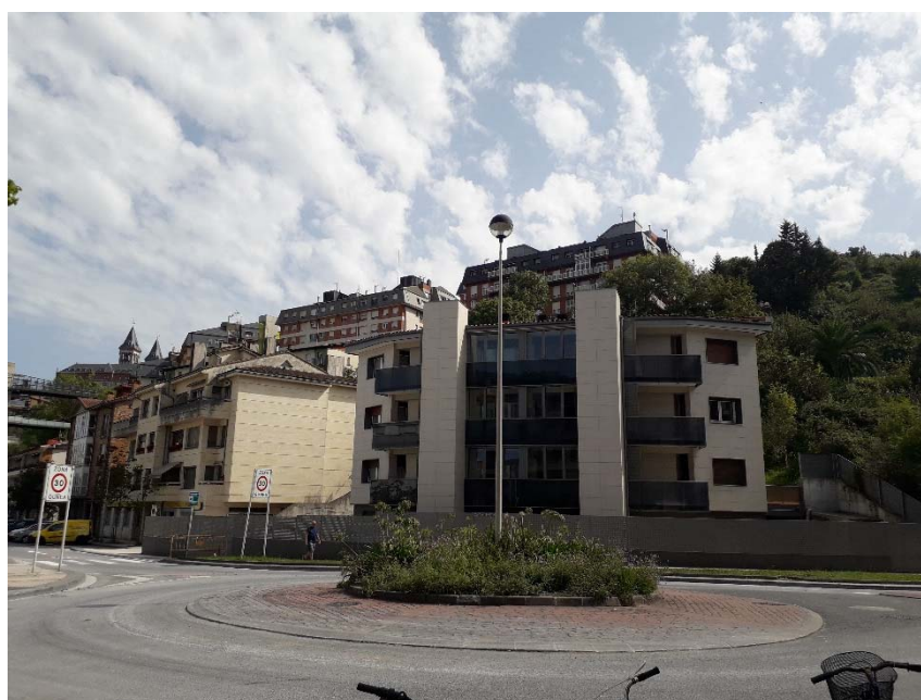
Imagen 6.- Edificación existente junto al emboquille