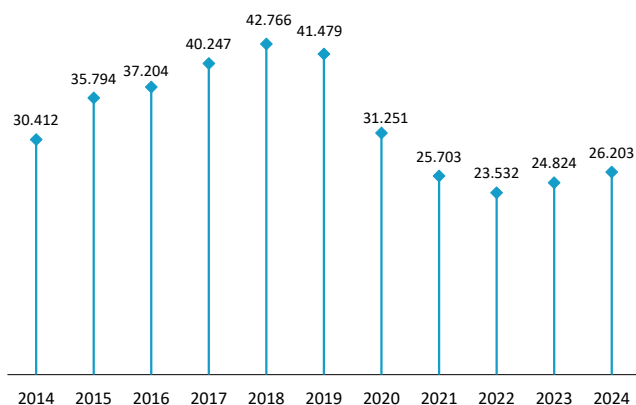
Turismoen matrikulazioa EAEn Urte bakoitzeko urtarriletik azarora bitartean