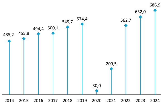
Hoteletan igarotako gaualdiak Urte bakoitzeko maiatza. Milakoak