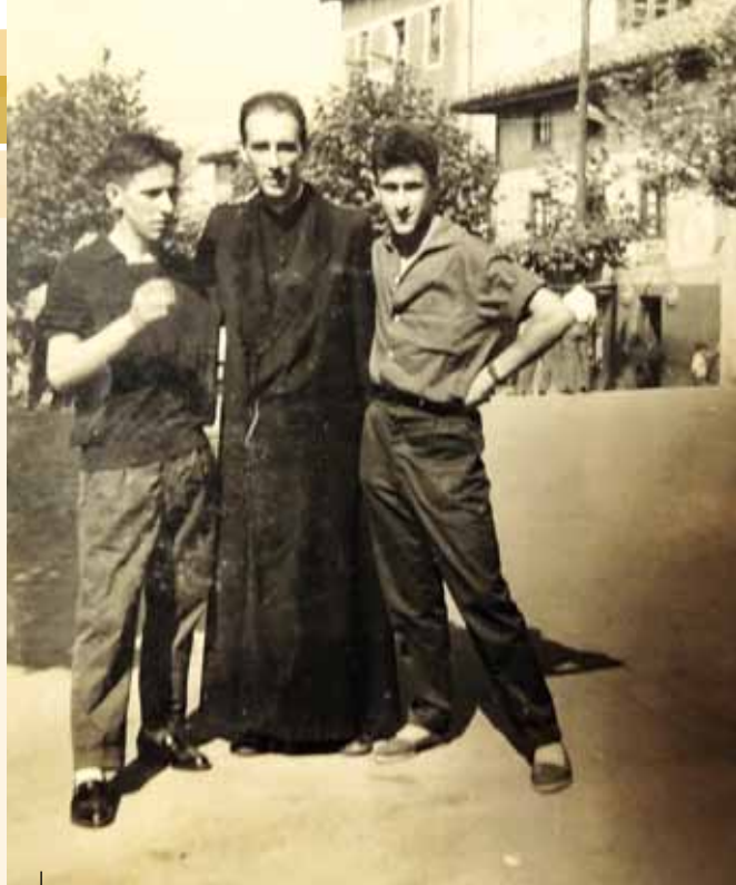
Periko en la plaza de La Arboleda

y muy solidaria. Los caminos estaban muy mal y sin luz, de noche no se podía salir, la luna llena era el mejor regalo; yo iba de La Arboleda a Triano a dar clases por la tarde y al volver, una noche sin luna, me tropecé con algo y digo ¿quién es? ¡Era un burro! Así que los sábados de verano, con un camión de la mina que nos dejaron, entre todos, incluso los niños, fuimos rellenando los baches para poder ir a La Arboleda.