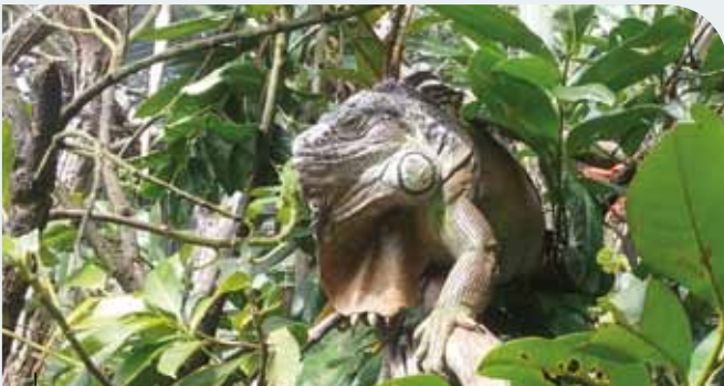
Las iguanas son unos de los reptiles que se compran y abandonan con más frecuencia