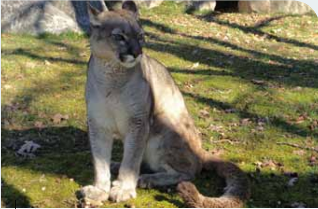
Luna es un puma decomisado en Tenerife