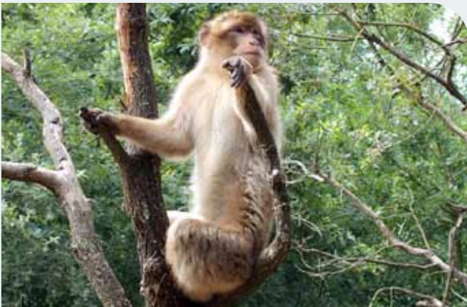
Macaco de Berbería, macho decomisado en Catalunya