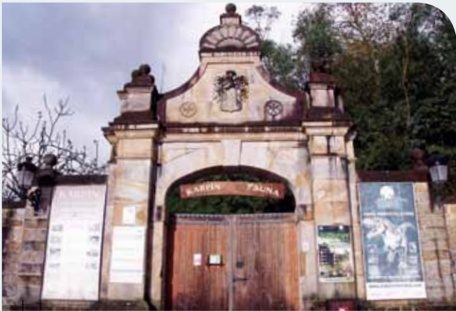
Entrada a Karpín Fauna

“Karpín Fauna” Faunako Abegi-Zentroa eta Parke Tematikoa da. Karrantza Haranako Biañez auzoan dagoen 19 hektareako lursail batean kokatzen da. Hemen 55 espezie desberdinetako 500 animalia basati, bai Europakoak bai exotikoak, baino gehiago bizi dira. Bi zona handi bereiz daitezke. Alde batetik, Animalia dugu, Faunako Abegi-Zentroa. Hemen honako animalia hauek ostatu egiten dira: trafiko edo edukitze ilegaletatik berreskuratutak, utzitako maskota exotikoak, ehiza ilegalagatik edo autoek harrapatutako berreskurazekin diren bertako animaliak, etab. Terrasauro eta Gastornisland Karpín Faunako beste bi zona dira eta hauek parke tematikoa osatzen dute. Eskala errealeko dinosauroen erreprodukzioak eta gizakiarekin bizi ziren animalia ezberdinak ikusten dira. Espezie guzti hauek ezagutzeaz aparte, ikasturtean zehar ingurumen hezkuntzako programa ezberdinak burutzen dira. Karpín Fauna zabalik dago asteburu, jaiegun eta eskola-oporretako egun guztietan. Periodo hauetaz kanpo bisitatzeko, hitzordua hartu behar da.