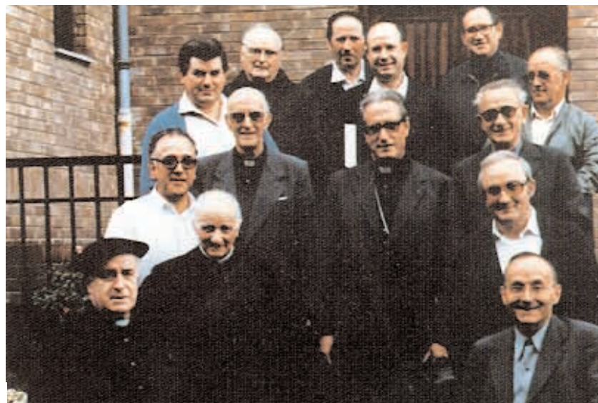
Liturgi Batzordeko euskal itzultzaileak (1984).

Liturgi lanei esker aurkitu zuen bere bizitzaren izateko arrazoirik pozgarrienetariko bat, bere norberezko historiaren zergati sakona. Eta eskaini ahal izan zuen bere laneko eskarmentua, jakinduria eta alderdi gizerakoa.