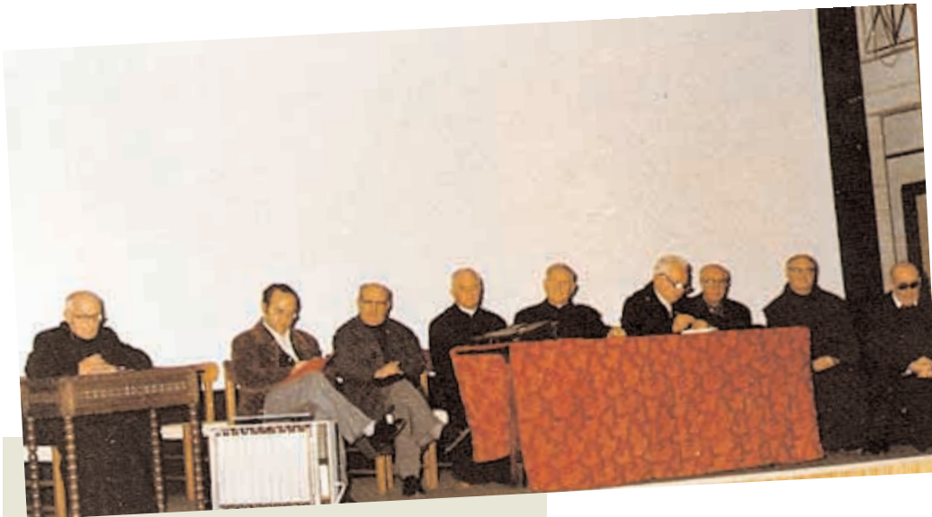
Kardaberaz Bazkuna: Omenaldia (1977).