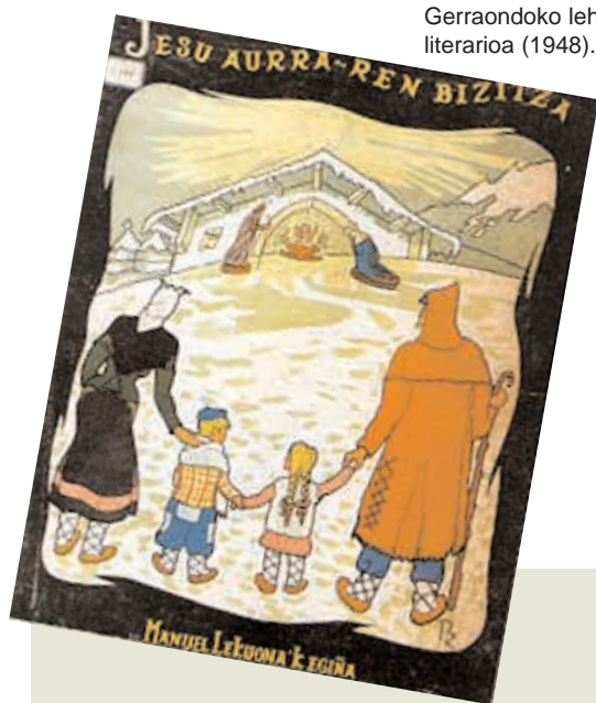
Gerraondoko lehen liburu literarioa (1948).

Inork gutxi bezala sentitu ohi zuen kontaerak berekin duen esanahi sinbolikoa eta emozio lirikoa. Eta azkenik, dohain jakingarriak zituen prosa ikasiaren mamikuntza bizi eta ederrerako.