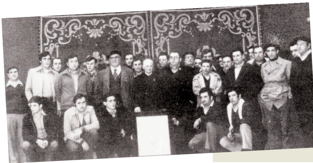
Bertsolariek egindako omenaldian (1979).

Eragin handia izan du euskal oralismoan; ez bakarrik gauzen ezagutzan, baita herri-literaturaren promozioan ere. Literatur politikan izan du eragina eskuarki, zer esanik ez tradiziozko emanaldietan, eta bereziki bertsolaritzaren eta teatroaren sustapen berrian.