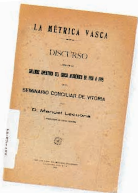
Ahozko euskal literaturaren inguruan.