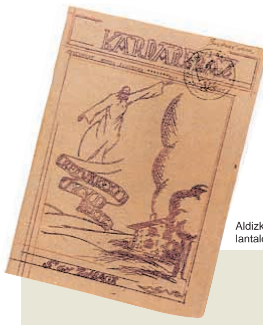
Aldizkaria, lantaldea zen (1935).