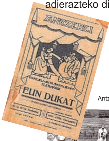
Antzerti-jendearen artean (Pagola, 1982).

Zigor-en , bitxi-lan finetan, azaldu digu bere esku ona: hitz-neurturako duen sena, tradiziozko poesi moldeen ezaguera, euskal bizitza eta adierazteko dituen baliabide sakonak.