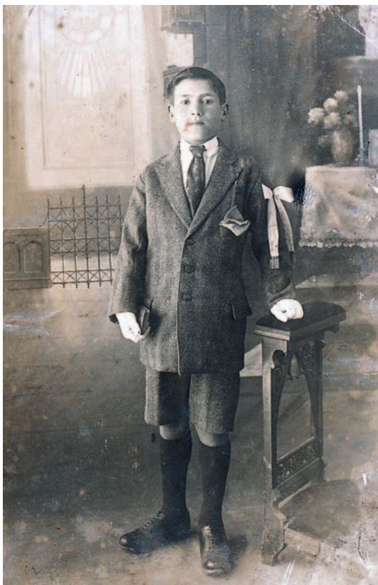
Komunio egunean. 1924