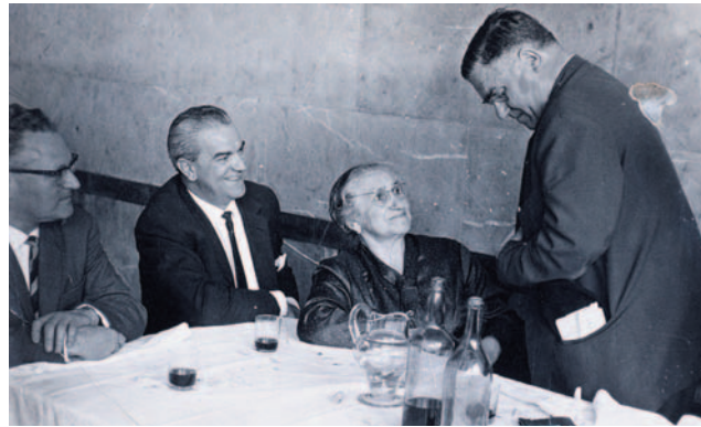
Bere amaren ondoan, saria hartuta

Nolanahi dela ere, kontu handiz eta hitzak ondo neurtuta kantatu behar izaten zuten. «Bertso borobil eta ateraldirik onenak burura etorri bai, baina kontuz itz egin bear izaten