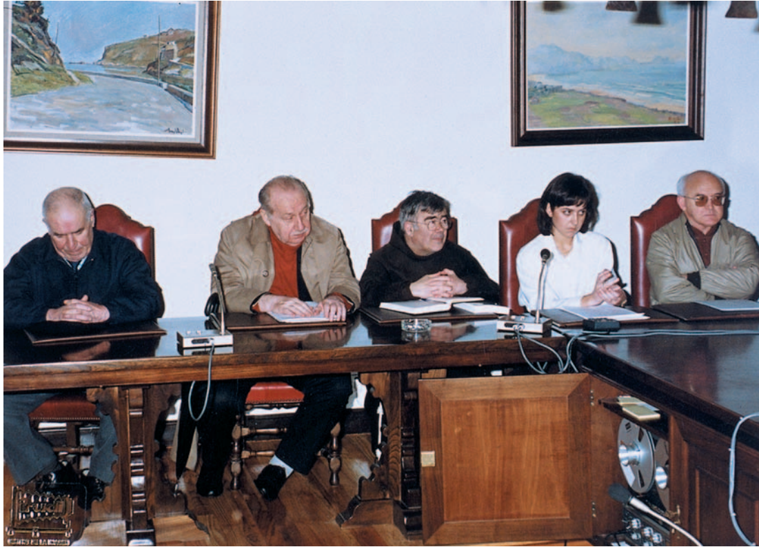
Zarauzko udaletxean, bere omenaldikoan. 1985