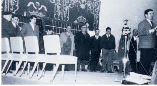
Bertsolari eguna Baldan

egunetan. Epai-mahaiak zuhur eta zuzen jokatuko zuen, baina zenbat buru hainbat aburu orduan ere. Eta ondorioak ekarri zituen, noski: bertsolari txapelketa eta sariketak hartantxe amaitu ziren, aldi baterako. Ez zen egin beste txapelketarik harik eta 1979 urtean Euskaltzaindiak, ahalegin askoren ondoren, berriro lehiaketak martxan jarri zituen arte.