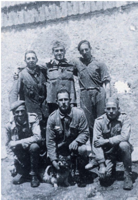
Trabajadoreetan bere lagunekin. 1939

Orain erraz kontatzen dira, baina ez ziren motzak izango atzerriko urte haiek. Izan ere, haien bihotza herri eta etxe-minez irakiten zegoen gau t'egun. Eta, bestalde, gurasoak, senideak, lagunak, denak etxera etortzeko deika. «ama gaixoa etxera etortzeko eta etortzeko ari zitzaidan, gauzak konpondu zirela-eta. Ez zitzaidala ezer pasatuko esaten zidan» kontatzen zuen Basarrik. Horrelaxe uste ama alargunak, eta horrela nahi semeak ere.