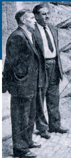
Uztapiderekin Arantzazuko saio batean

Alabaina, bertsolariak behar-beharrezko osagarri izaten ziren herri euskaldun askotako zaindari jaietan. Eta Eusebio Eizmendi Txapel , Akilino Izagirre Zepai , Paulo Zubiarrain Hernani Txikia , Loidisaletxe eta abarrekin etengabe ibili zen, jo batera eta ekin bestaldean. Basarri