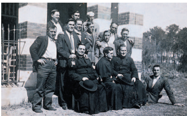
Ichoux - Landatan. 1938.04.19

Eta handik ere laster partitu behar, berriz ere etsaiarengandik ihesi. Isilka eta larri, ume, elbarri eta gaixoak zeramatzan Sarastone un- tzian sartu, eta Frantziara joan ziren uztail triste hartan, eta Nantes ondoko herri txiki batean gelditu. Eta gaitzerdi, gainera: Landesko baso eta oihanetan lana aurkitu