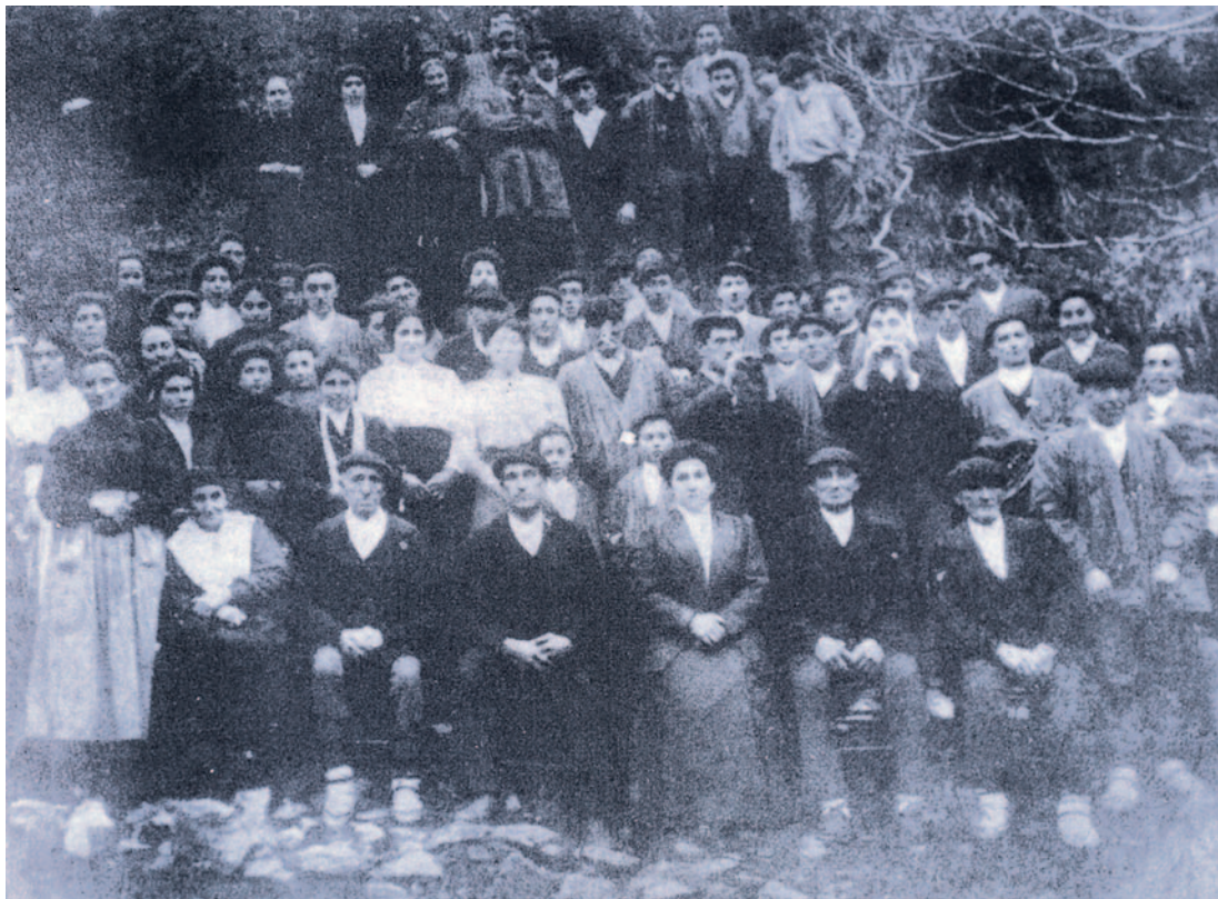
Gurasoen ezkontza eguna

gor eta traketsa zela-eta familia hazi eta hezteko.