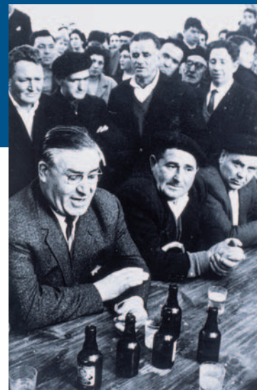
Oiartzunen Uztapideren omen jaialdi batean

eta Uztapideren txanda eta moda etorri zen 1945etik aurrera, batez ere.