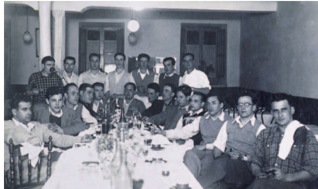
Zarautzen 1948ko martxoan