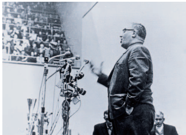
Bertsolariak Anoetan. 1968

Baina horrelako neurketetan ohikoa denez, kritika eta esamesa asko izan zen ondorengo