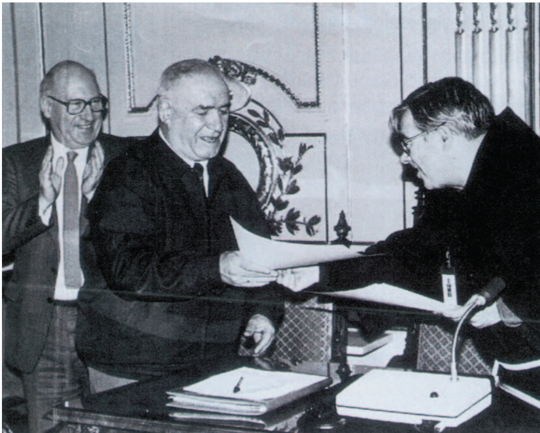
Basarri ohorezko euskaltzain agiria jasotzen Villasanteren eskutik, Foru Aldundian. 1985

Hori guztia nolabait eskertzeko-edo, Oho-rezko euskaltzain izendatu zuen Euskaltzaindiak 1984ko azaroaren 30ean. Gutxiago merezi zuenen bat izendatuko zuen, seguru asko.