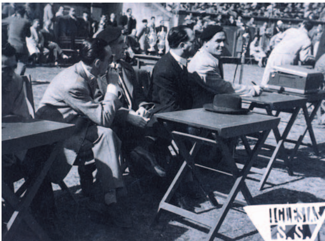
Apustuari adi Donostian 1950.03.05ean

Han eta hemen azterka ibili ondoren ikusi dugunez, lehenengo bertsoak hamasei urtekin argitaratu zituen Basarrik, Dantza nas-