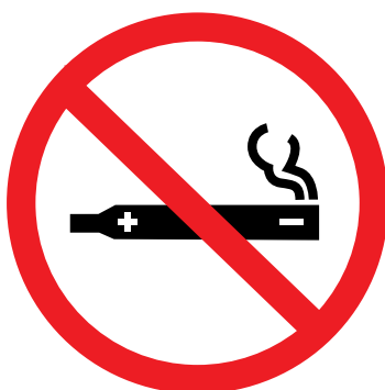
Dispositivos susceptibles de liberación de nicotina