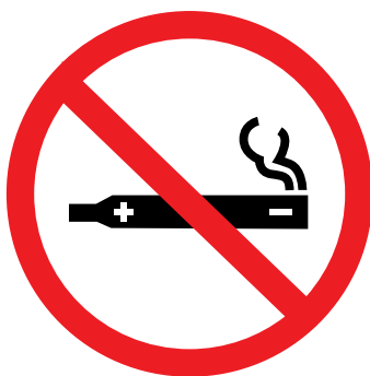
Dispositivos susceptibles de liberación de nicotina