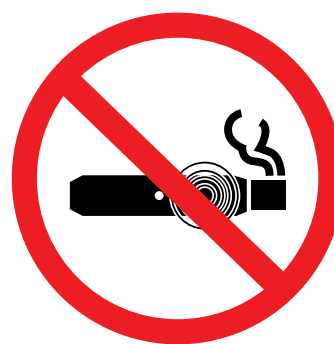
Otros productos de tabaco